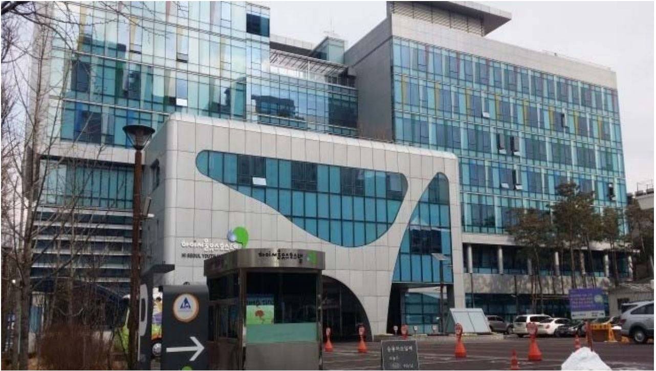
하이서울유스호스텔 / 주소: 서울특별시 영등포구 영신로 200