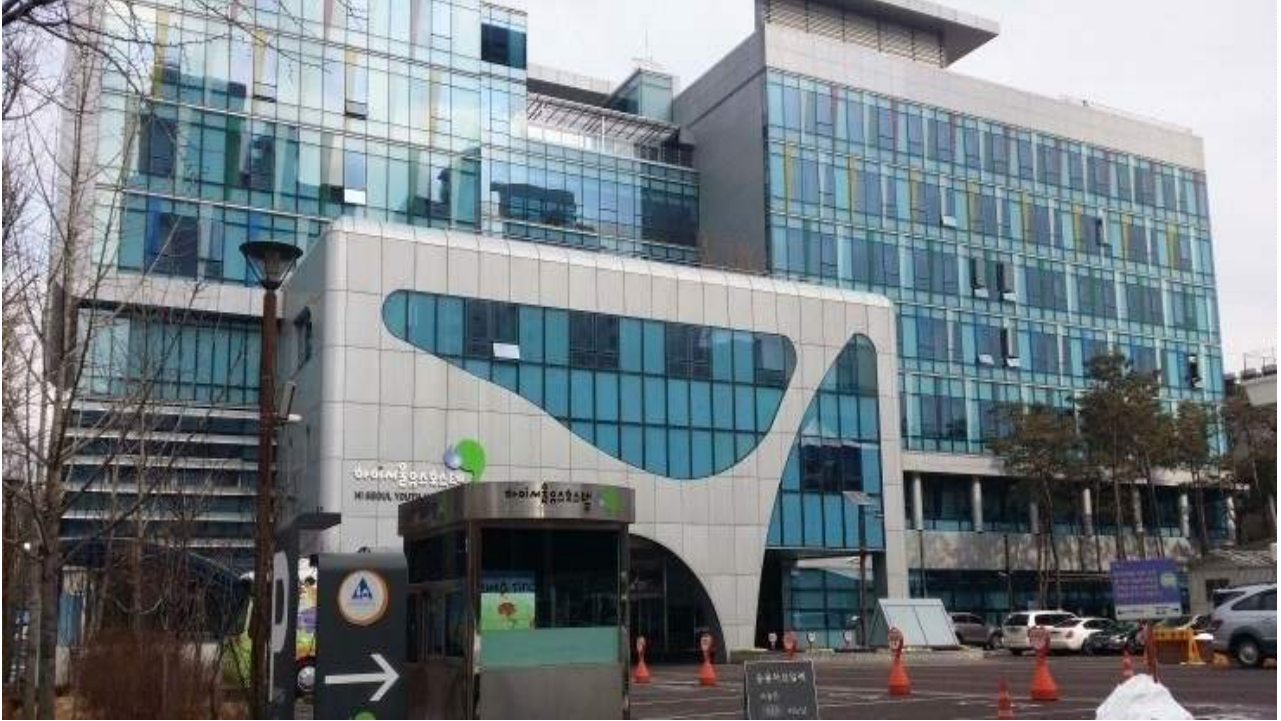
하이서울유스호스텔 / 주소: 서울특별시 영등포구 영신로 200